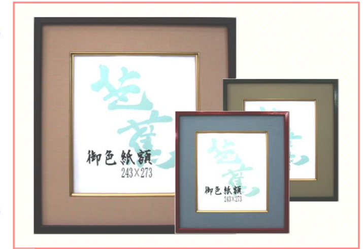
T 芭蕉 (布マット) 【ブラウン、グリーン、朱】

縁巾：15mm 材質：木製 在庫ポリシー：受注生産 別注対応：可能/コード>02-W116