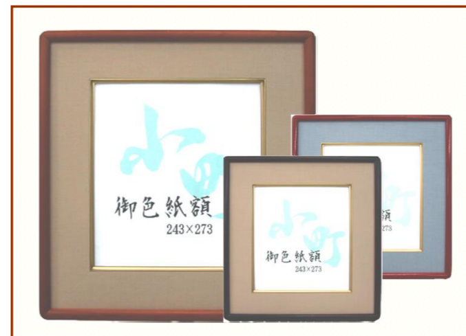
T 小町 【ダーク、マホ、朱】

縁巾：15mm 材質：木製 在庫ポリシー：受注生産 別注対応：可能/コード>02-W116