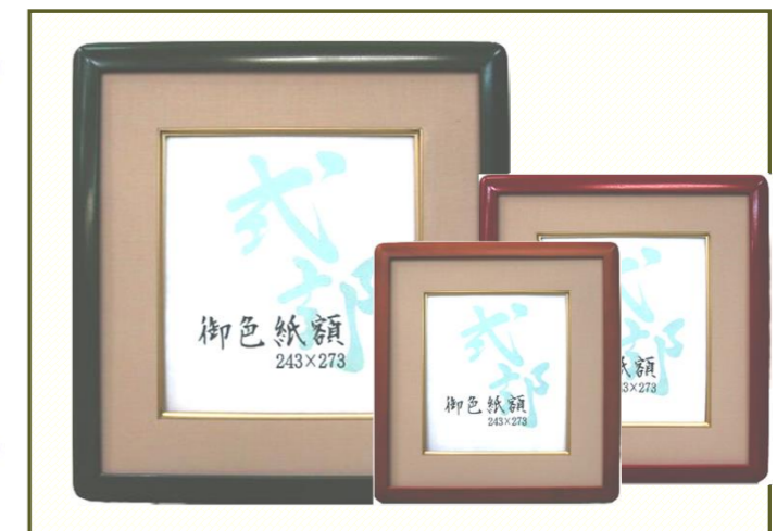
T 式部 【グリーン、ダーク、朱】

縁巾：16mm 材質：木製 在庫ポリシー：受注生産 別注対応：可能>お問い合わせ下さい。