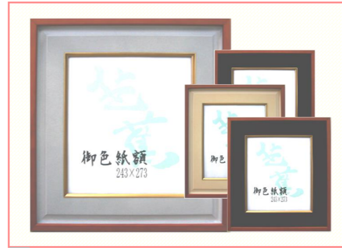
T 芭蕉 (フロッキー) 【グレー、エンジ、ベージュ、紺】